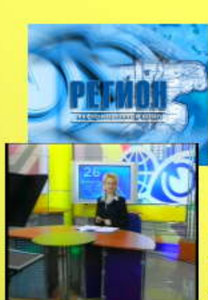
«Регион» Пн.-Пт. «Регион-Итоги» Сб.-Вс.

В текущем телевизионном сезоне ТРК «МТВ-плюс» производит собственные программы: